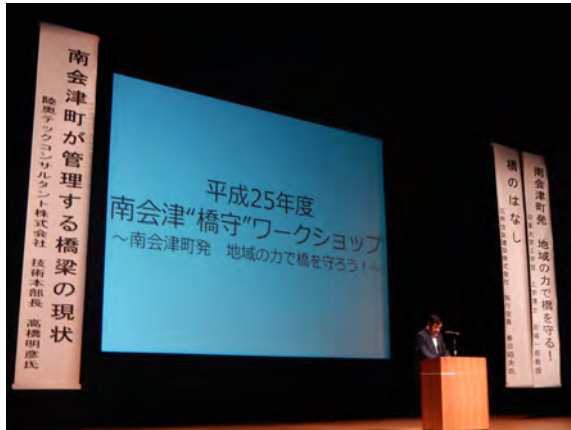
ワークショップの開催

出席者：道路管理者、ふくしまインフラ長寿命化研究会員、地域の測量設計会社及び建設業者、日大学生、地域住民