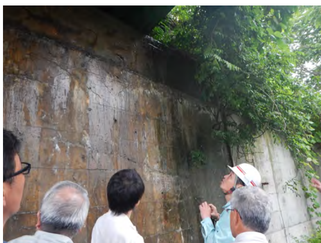
南会津管内 橋梁視察状況 4 (ASRにより劣化した橋台)