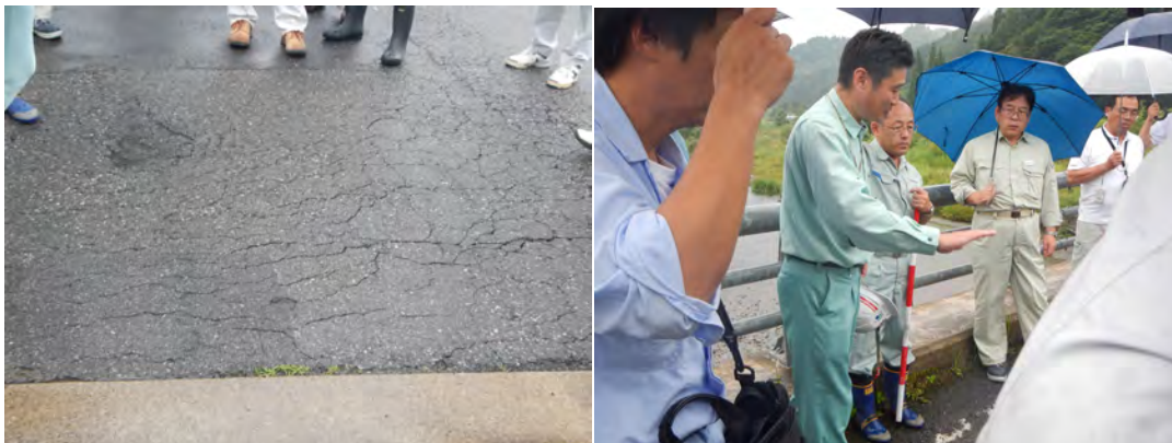
南会津管内 橋梁視察状況 2（舗装異常箇所におけるその原因の議論）