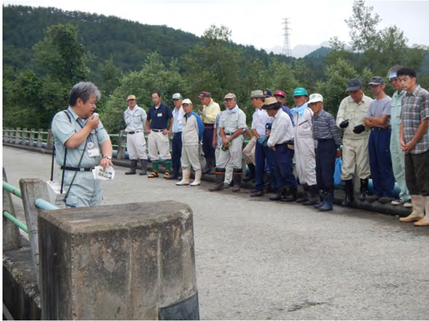
簡易な橋の維持管理のポイント解説状況 1