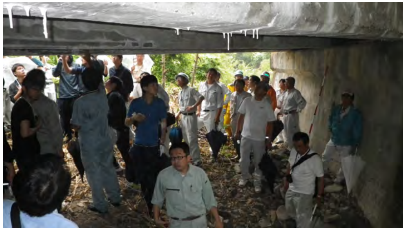
南会津管内 橋梁視察状況 1（凍害橋）