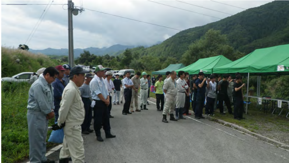
永田地区の住民の皆さんとの開会式

出席者：道路管理者、ふくしまインフラ長寿命化研究会員、地域の測量設計会社及び建設業者、日大学生、地域住民、商工会青年部