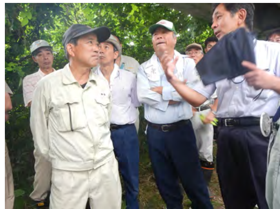
住民の皆さんの質疑と応答の状況