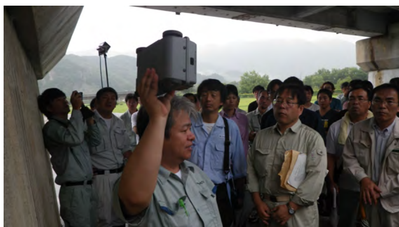
橋梁点検手法の講習状況