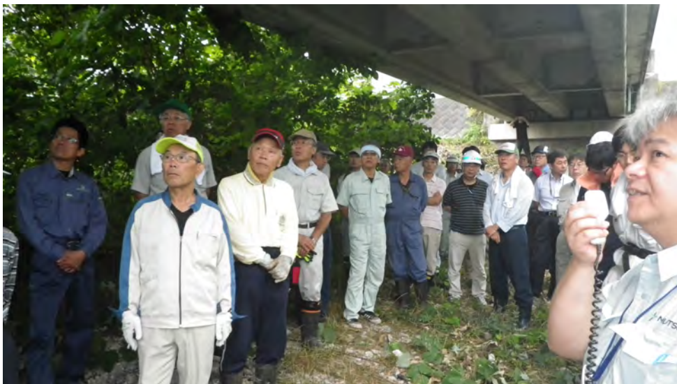
簡易な橋の維持管理のポイント解説状況 2