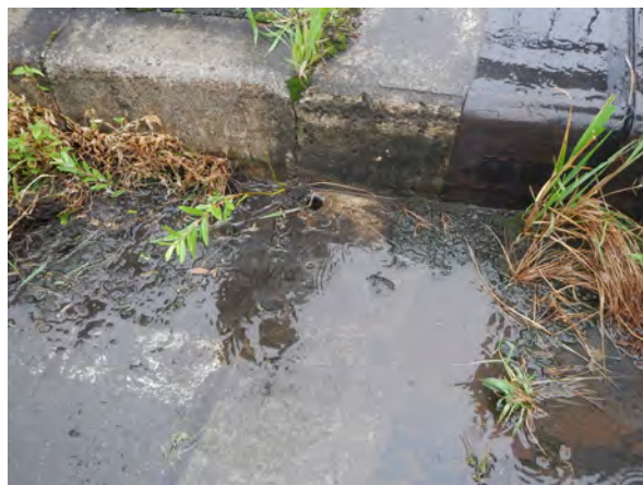
南会津管内 橋梁視察状況 3 (ジョイント部における劣化の誘因になる水たまりの発見, 排水口の詰まりを除去)