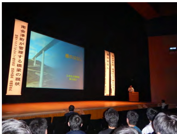
春日氏(三井住友建設)の講演